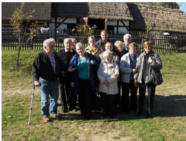
Wycieczka do Karpicka