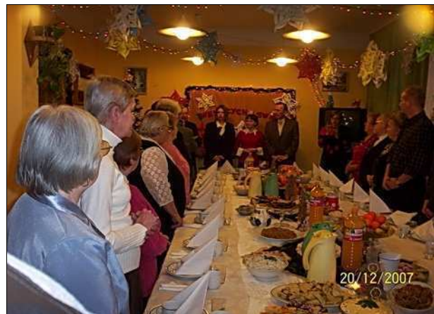
Spotkanie wigilijne w DDPN

Dom Dziennego Pobytu Nieśłyszących kontynuuje współpracę z Wydziałem Pedagogiki Socjalnej i Resocjalizacyjnej Uniwersytetu Szczecińskiego. Dwie grupy studentów V roku tego kierunku zrealizowały projekty socjalne na terenie placówki w bieżącym roku.