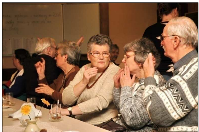
Spotkanie Seniorów w sali klubowej

Jak ogólna statystyka wykazuje duża grupa naszych podopiecznych to osoby po 60-tym roku życia. To dla nich tworzone są koła seniora, w których pracujemy nad aktywnością osób starszych. Zachęcamy ich do czynnego udziału w wycieczkach rehabilitacyjno-krajoznawczych, wszelkiego rodzaju zajęciach na wolnym powietrzu, zabawach przy ognisku, grillowaniu na polanie, spacerach do parku – na zajęciach bierzemy pod uwagę sprawność grupy i do niej dopasowujemy stopień trudności organizowanych zajęć. Ustalony jest harmonogram comiesięcznych spotkań w klubie z uroczystą oprawą, przy świątecznie nakrytych stołach seniorzy piją herbatkę pogryzając słodkie ciasteczka.