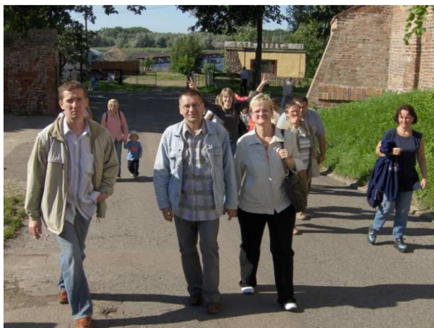
Wycieczka do Pobierowa i Kamienia Pom.