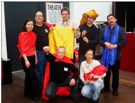
Uczestnicy warsztatów teatralnych