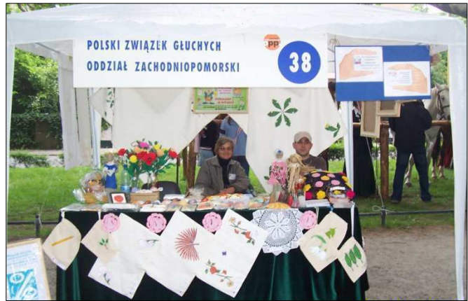
Spotkanie organizacji pozarządowych kiermasz ilustrujący działalność PZG Szczecin "Pod Platanami"

Chętnie wykonywane są wszelkiego rodzaju elementy, które wywodzą się z polskich tradycji, były to np. palmy wielkanocne, stroiki wielkanocne z barankiem, czy wiele innych, zależnie od pomysłu wykonawcy. Także życzenia świąteczne wypisywane były na kartkach wykonanych wg własnych pomysłów. W 286 spotkaniach koła wzięło udział 1044 osób.