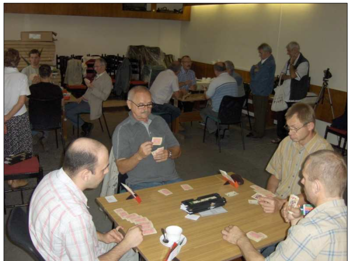
Turniej brydża sportowego niesłyszących

We wszystkich dyscyplinach sportowych, poprzez zajęcia na boisku przyszkolnym, czy w wynajętych salach gimnastycznych brały udział drużyny ze wszystkich Kół Terenowych.