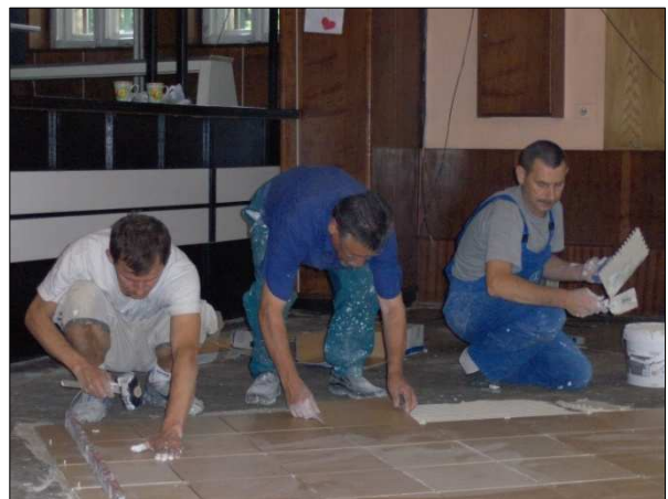
Kładzenie terakoty w sali klubowej

A zadania wynikają z potrzeb w lokalach, z których korzystają. Są to prace naprawcze, np. odnawianie krzeseł, stołów, biurek, malowanie i tapetowanie. Modernizacja sprzętu technicznego,