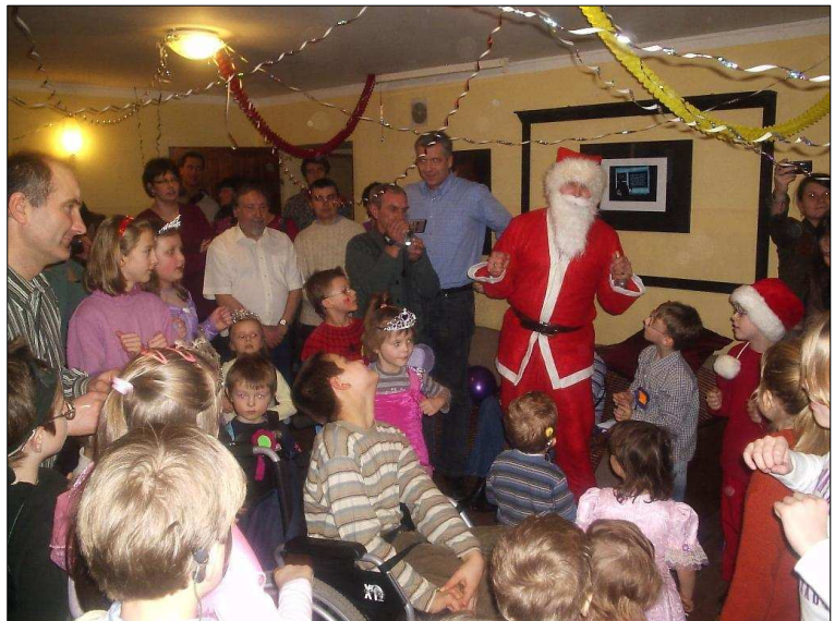
Zabawa choinkowa w Centrum Diagnostyki