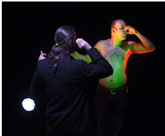
Spektakl „Raport z Akademii”