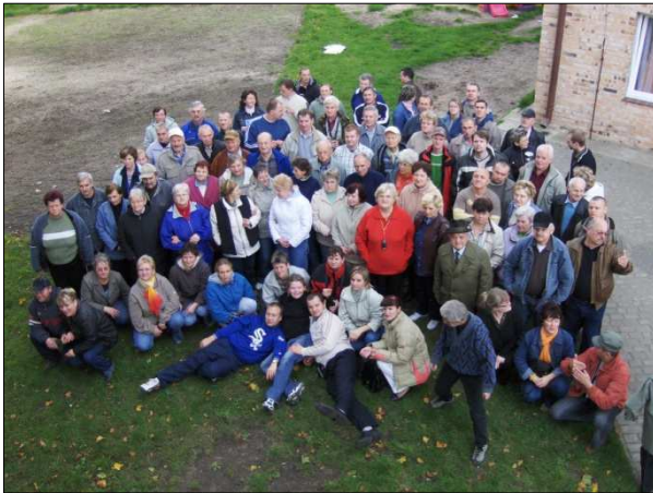
Międzynarodowy Dzień Głuchego w Jarosławcu

W dniach 28.09.-30.09.2007 zorganizowaliśmy wyjazdową Wojewódzką imprezę z okazji Międzynarodowego Dnia Głuchego w nadmorskim Ośrodku Wczasowym „Rafa” w Jarosławcu. Była to okazja do spotkania się niesłyszących ze wszystkich Kół Terenowych naszego Oddziału. W imprezie uczestniczyło 120 osób.