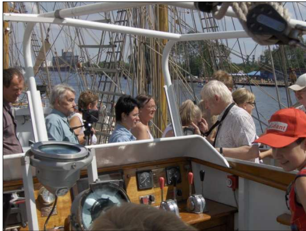
Na pokładzie „Lorda Nelsona”

podopiecznych nie tylko ze Szczecina, ale również z Koszalina, Stargardu Szczecińskiego i Wałcza