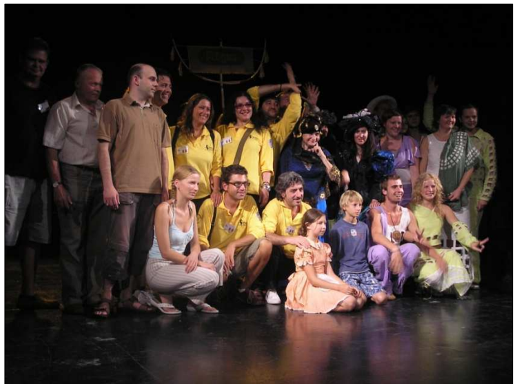
Niesłyszący aktorzy na Festiwalu w Wilnie.