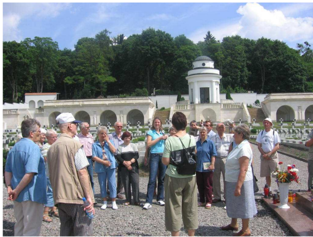
Wycieczka do Lwowa. Cmentarz Orłąt Lwowskich.

historię najciekawszych zakątków naszego kraju, a nawet krajów sąsiednich tj. Lwowa. Nigdy nie byłoby w stanie poznać historii i kultury ani bogactw muzeów, gdyby nie obecni wśród nich tłumacze języka migowego. To tłumacze w języku zrozumiałym dla niepełnosprawnych słuchowo przekazują im wiadomości mówione przez przewodników.