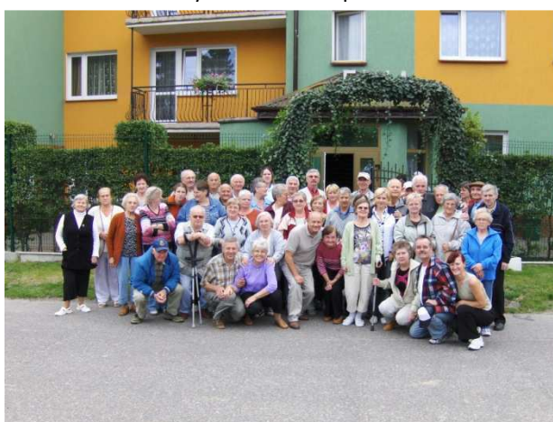
Turnus rehabilitacyjny w Ustce.

W roku 2007 dzięki uzyskaniu indywidualnych dotacji z MOPR i PCPR 88 osób wzięło udział w turnusach rehabilitacyjnych, które odbyły się w Zakopanym i Ustce. Pomagaliśmy podopiecznym podczas badań lekarskich oraz wypełnić wnioski na dofinansowanie w MOPR i PCPR. Korzystnym dla uczestniczących niesłyszących było wspólne przebywanie na turnusie