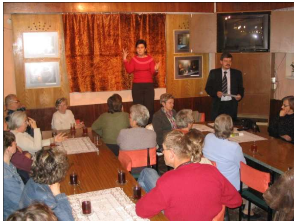
Spotkanie z przedstawicielem banku na temat „Jak korzystać z usług bankowych”

się biorą choroby”, „Jak redukować stres”, „Profilaktyka chorób kobiecych”, „Profilaktyka w leczeniu schorzeń gruczołu krokowego”.