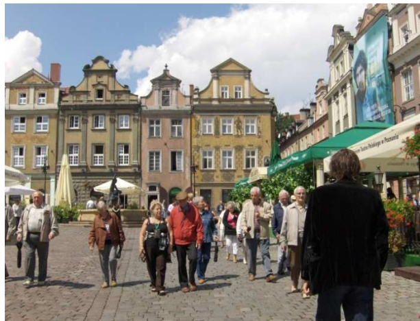
Wycieczka do Poznania.