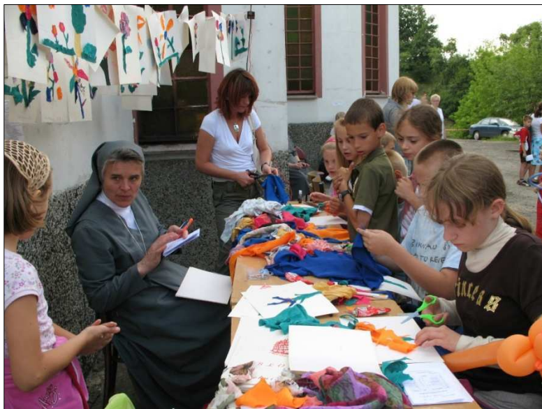
Prace dzieci głuchoniewidomych na festynie parafialnym

W okresie sprawozdawczym przyjęto do PZG Centrum 22 dzieci, u których rozpoznano trwałą wadę słuchu, w tym 11 niemowląt z przesiewowych badań słuchu.