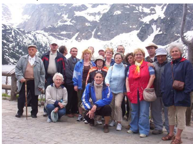
Turnus rehabilitacyjny w Zakopanym.