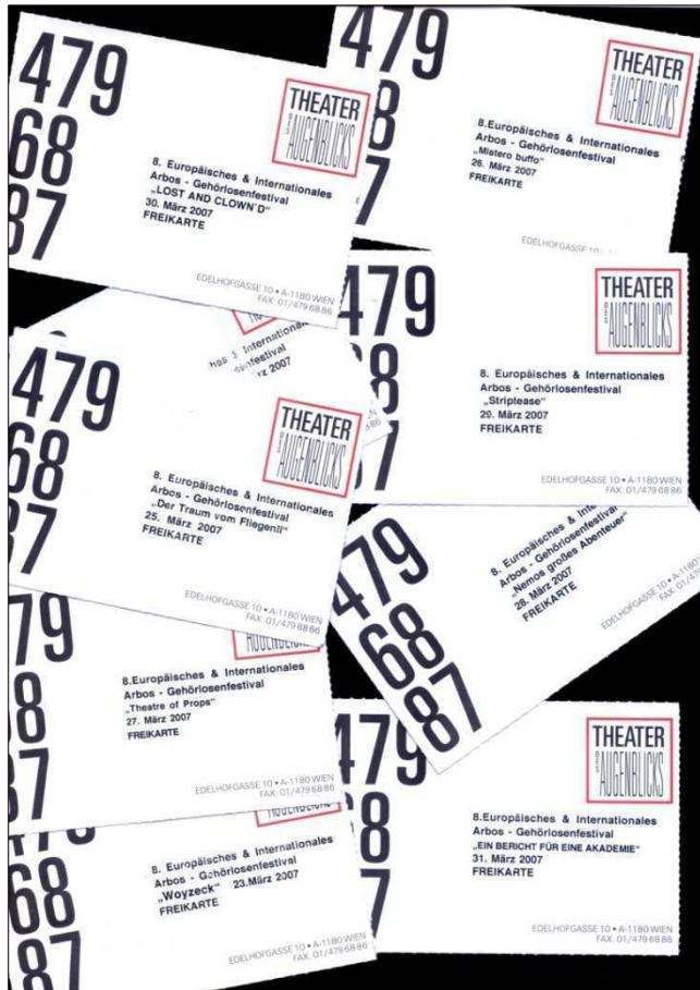
Bilety występu na Europejski Festiwal Teatru Niesłyszących w Wiedniu

oraz jego wartości w komunikowaniu się ludzi różnych narodowości. Język migowy został nazwany „Językiem korzeni” i największym językiem ze wszystkich używanych na scenie.