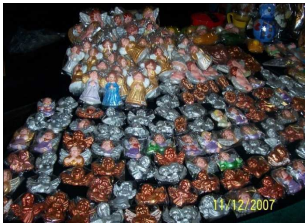
Kiermasz Przedświąteczny na terenie Urzędu Wojewódzkiego